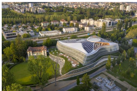
CIO – Maison Olympique

Tu trouveras des informations détaillées sur le bureau sous www.ingeni.ch .