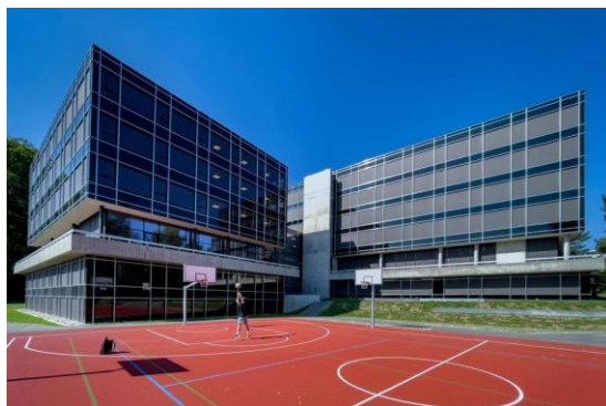
Collège St-Croix Fribourg