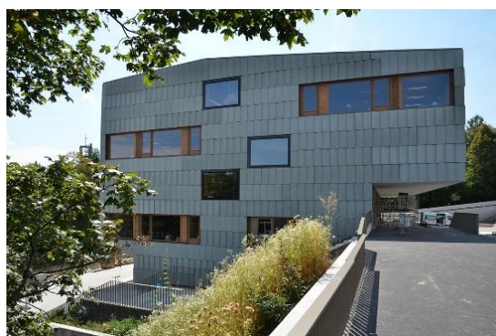
DOSF – Cycle d'Orientation à Fribourg